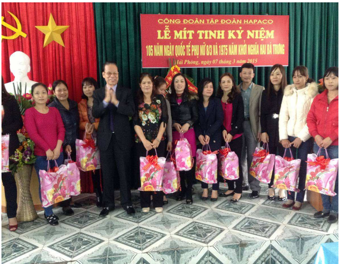
TRAO THƯỞNG PHỤ NỮ TIÊN TIÊN XUẤT SẮC NHÂN NGÀY 08/03.