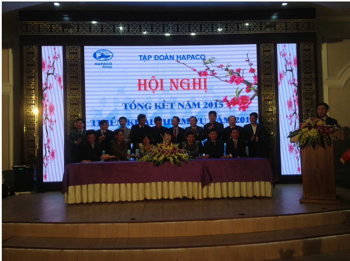
KÝ KẾT GIAO ƯỚC THI ĐUA GIỮA CÁC ĐƠN VỊ THÀNH VIÊN TRONG HAPACO 2015