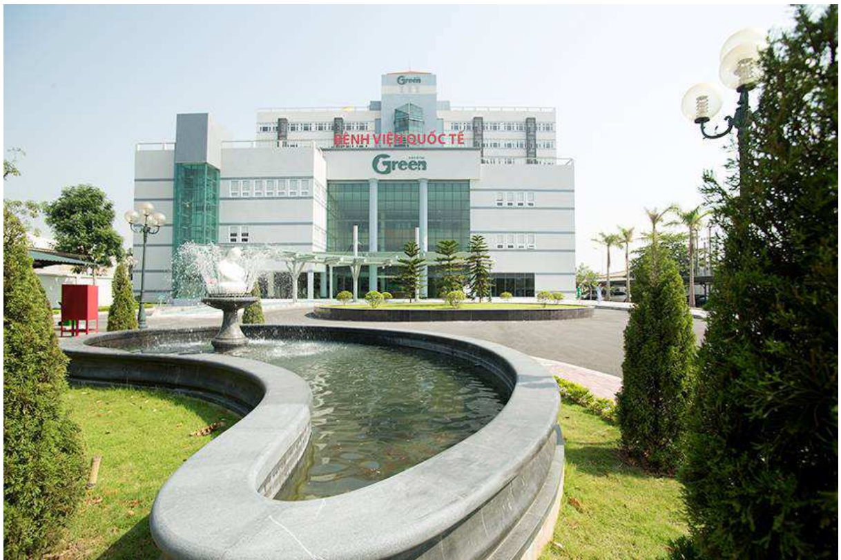
QUANG CẢNH PHÍA TRƯỚC BỆNH VIỆN QUỐC TẾ GREEN

Tập đoàn đưa dự án Bệnh viện Quốc tế Green vào hoạt động đúng tiến độ với tổng vốn đầu tư 447 tỷ đồng là công trình chào mừng 85 năm thành lập Công đoàn Việt Nam. Hiện nay, Bệnh viện đã đi vào hoạt động ổn định, số lượng bệnh nhân đến khám và điều trị tháng sau cao hơn tháng trước.