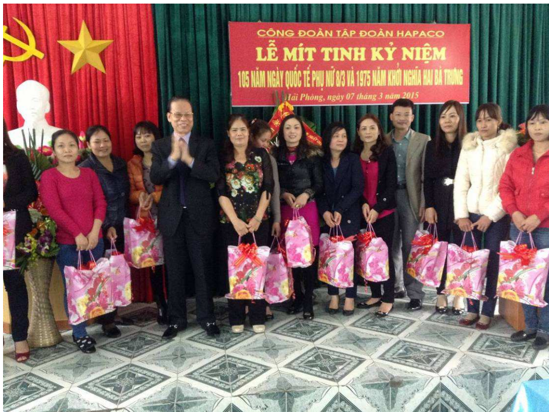
Tặng quà nữ cán bộ công nhân viên tiên tiến xuất sắc