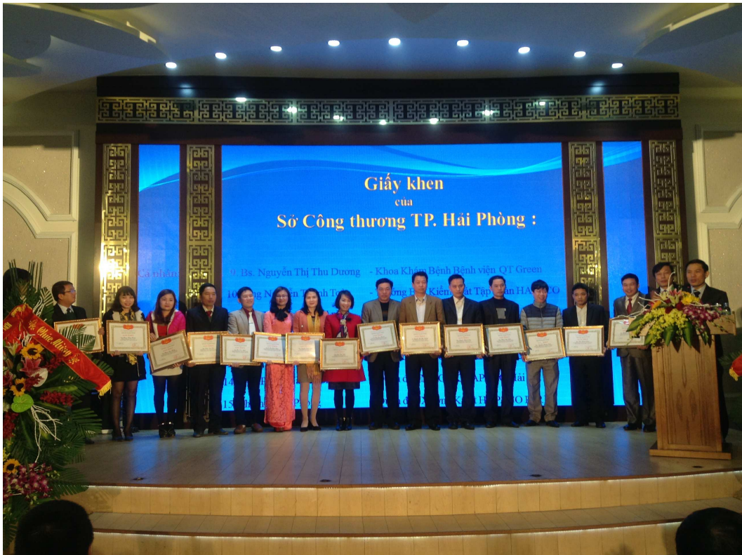
Lễ tổng kết năm 2015