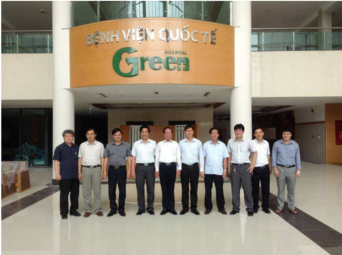
Lãnh đạo UBND Tỉnh Sơn La thăm và làm việc tại Bệnh viện Quốc tế Green