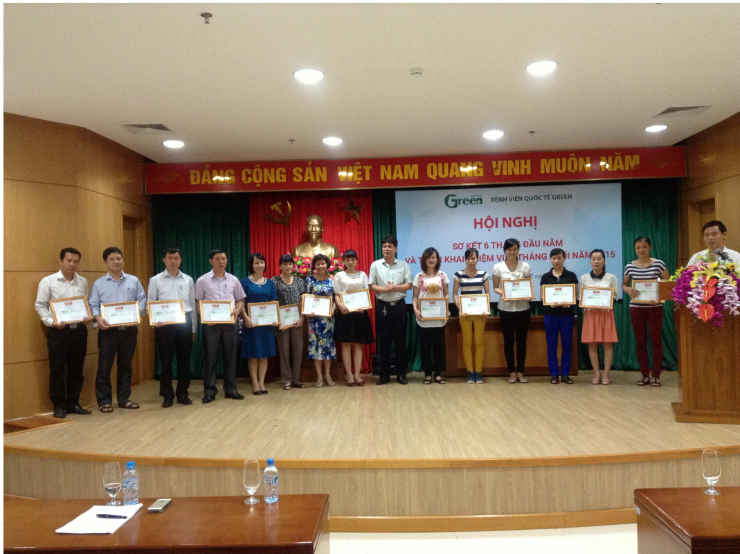
Hội nghị Sơ kết 6 tháng đầu năm 2015 Bệnh viện Quốc tế Green