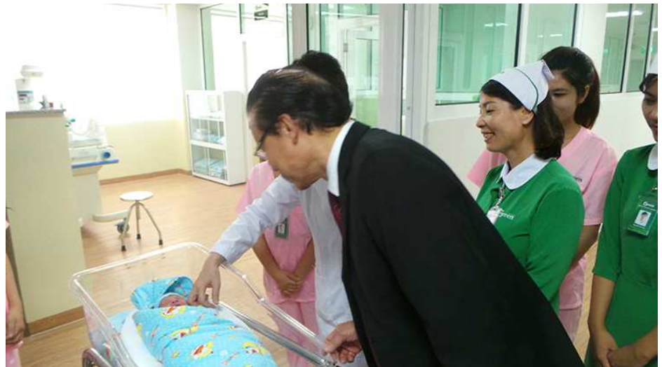
CHÁU BÉ ĐẦU TIÊN CHÀO ĐỜI TẠI BỆNH VIỆN QUỐC TẾ GREEN

chuyên môn nghiệp vụ cần phải giáo dục phẩm chất, đạo đức trong kinh doanh, có tâm huyết và trung thành với Tập đoàn.