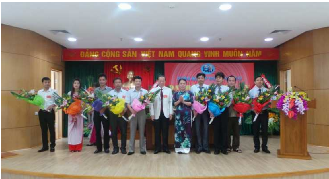
Đại hội Đảng bộ lần thứ XV nhiệm kỳ 2015-2020 của Tập đoàn HAPACO