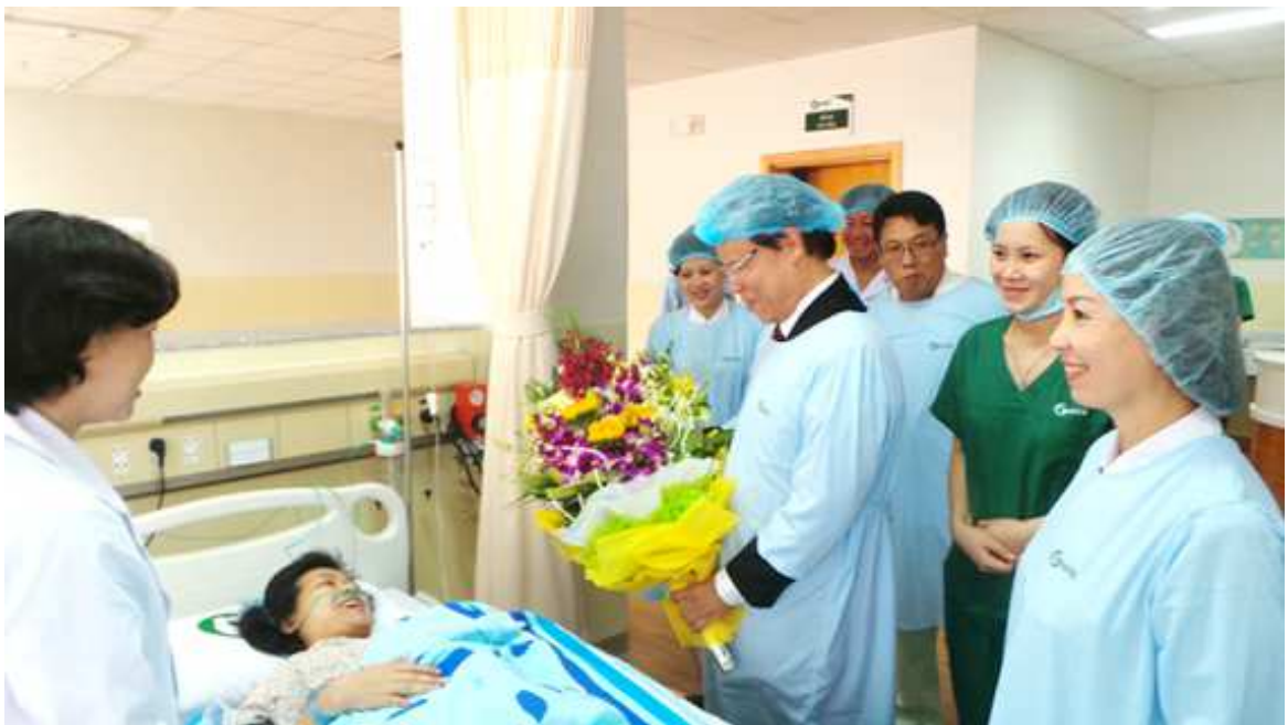
SẢN PHỤ CA ĐẸ ĐẦU TIÊN TẠI BỆNH VIỆN QUỐC TẾ GREEN