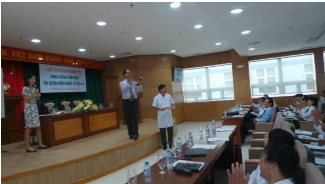
CHUYÊN GIA HÀN QUỐC TẬP HUẤN CHO CBCNV BỆNH VIỆN QUỐC TẾ GREEN