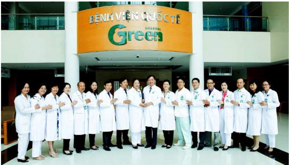
ĐỘI NGŨ Y BÁC SĨ BỆNH VIỆN QUỐC TẾ GREEN