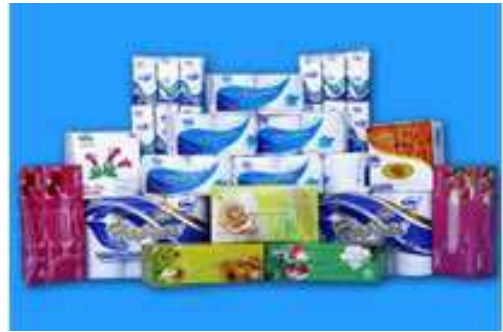
SẢN PHẨM GIẤY TISSUE

Năm 2012, nhằm đáp ứng nhu cầu giấy tissue của thị trường, Tập đoàn đầu tư thêm 02 dây chuyền giấy vệ sinh tại Công ty H.P.P có đủ điều kiện cần thiết cho lắp đặt và đã đưa vào sản xuất.