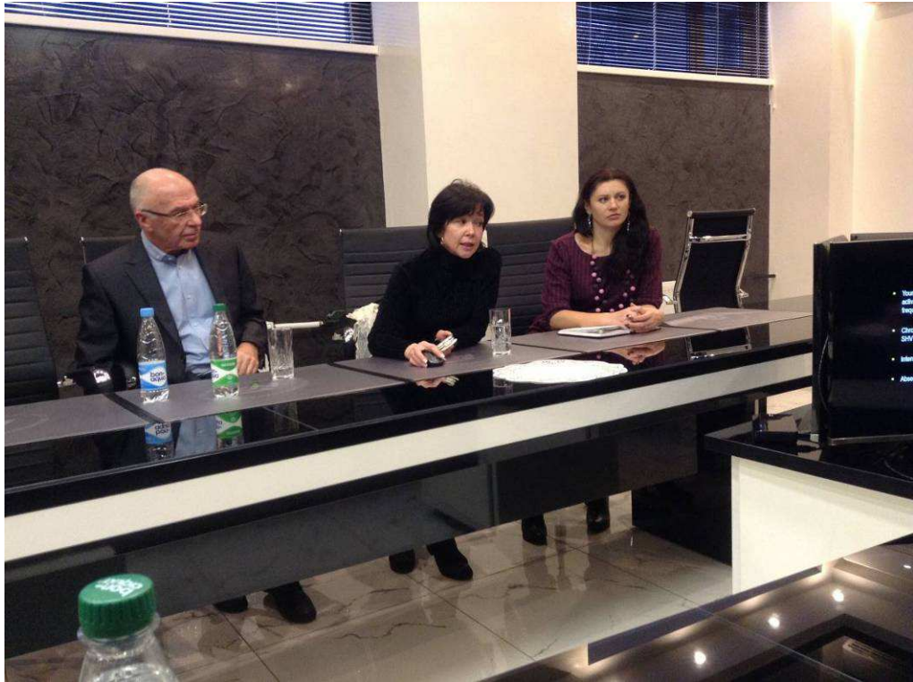
Ban Lãnh đạo Tập đoàn thăm và ký kết hợp tác với Nhà máy sản xuất thuốc chống ung thư - Cộng hòa Belarus