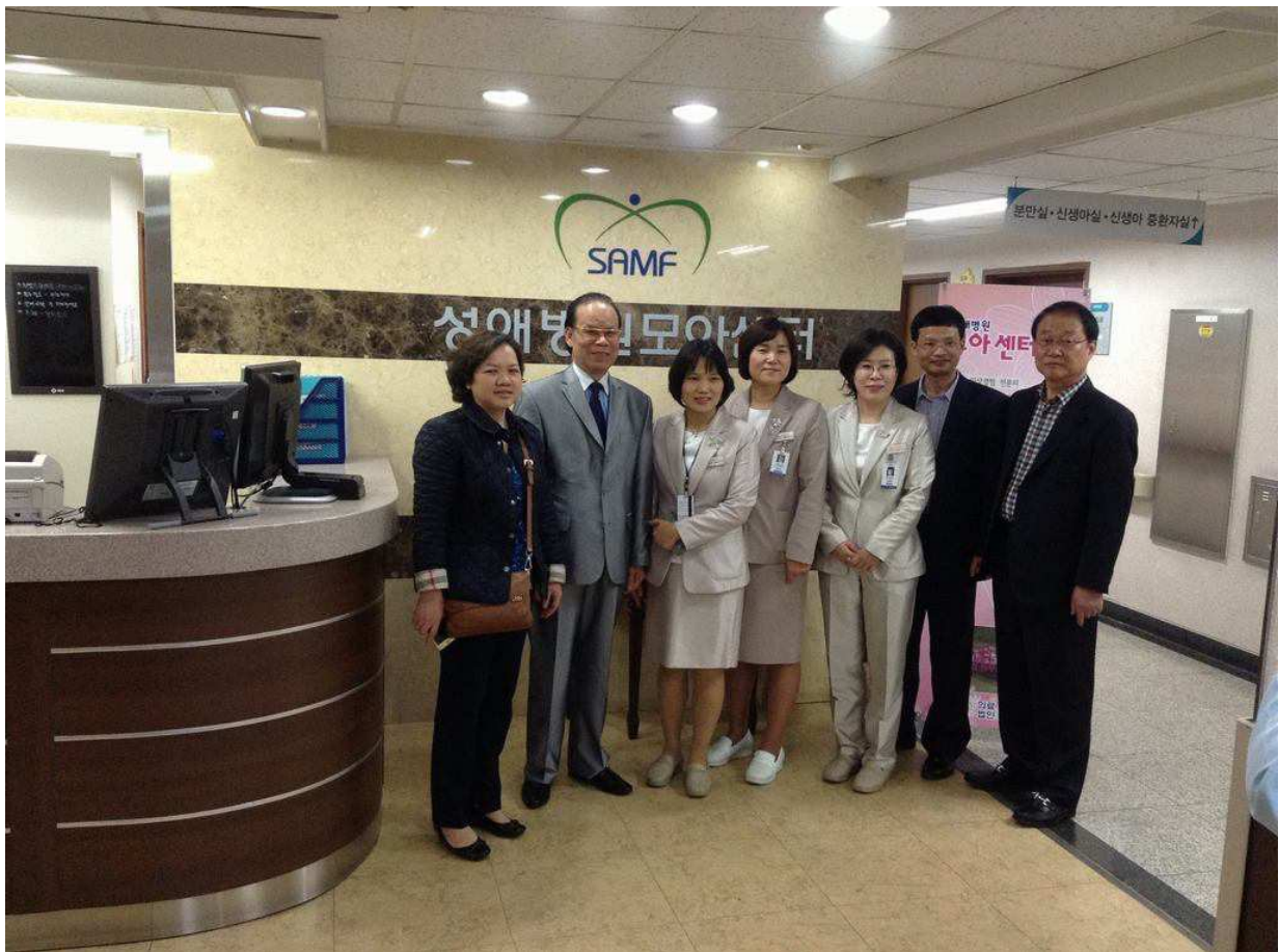
ĐOÀN BÁC SĨ BVQT GREEN THĂM BỆNH VIỆN SUNG AE HOSPITAL HÀN QUỐC

Việc mở cửa thị trường sẽ tạo ra áp lực cạnh tranh gay gắt cho tất cả các doanh nghiệp hiện đang hoạt động trong lĩnh vực sản xuất giấy. Các doanh nghiệp có vốn đầu tư nước ngoài với tiềm lực tài chính mạnh và phương pháp quản lý khoa học sẽ là những đối thủ cạnh tranh thực sự đối với các doanh nghiệp trong nước.