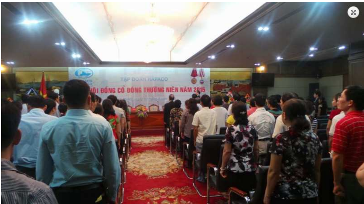
Đại hội đồng cổ đông thường niên 2015