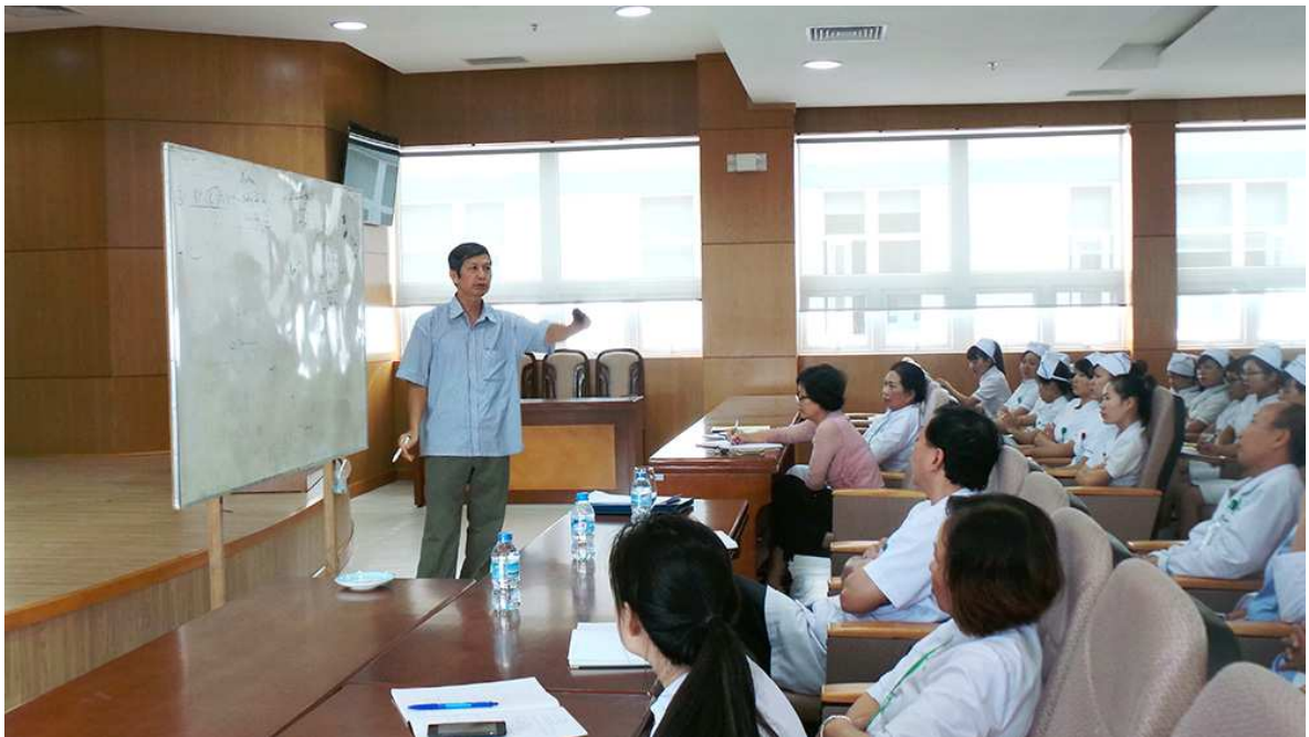
HỘI THẢO TẠI BỆNH VIỆN QUỐC TẾ GREEN

từng dự án; thực hiện tốt công tác tuyển dụng đào tạo, bố trí sử dụng và đãi ngộ đối với từng chức danh, vị trí, từng ngành nghề, từng công việc; phân phối thành quả lao động phù hợp với công sức đóng góp của mỗi thành viên trong quá trình quản lý điều hành và sản xuất kinh doanh, nhằm giữ chân đội ngũ quản lý và lao động giỏi hiện có đồng thời thu hút được nhiều hiền tài đến với Tập đoàn. Thực hiện nghiêm túc việc khoán sản phẩm tới ca sản xuất nhằm tối đa khả năng sáng tạo trong lao động sản xuất của cán bộ công nhân viên, kích thích tinh thần làm