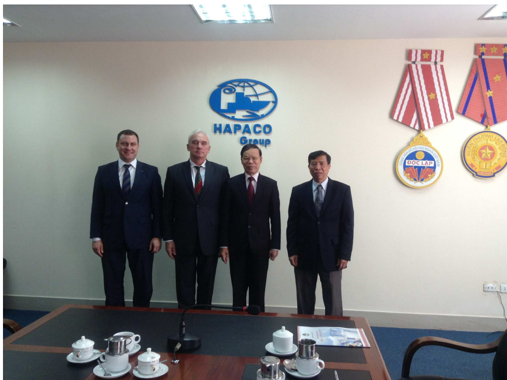
Đại sứ đặc mệnh toàn quyền Cộng hòa Belarus thăm và làm việc tại Tập đoàn HAPACO