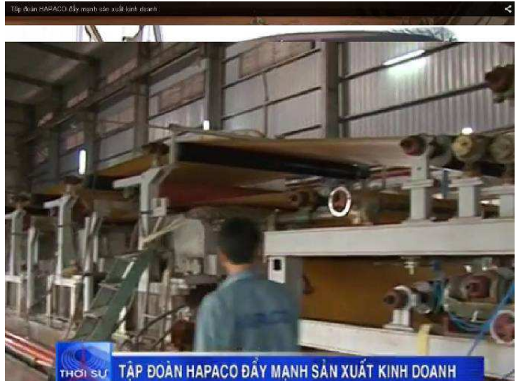
DÂY TRUYỀN SẢN XUẤT GIẤY KRAFT